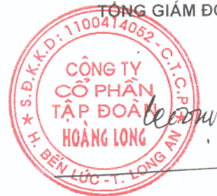
PHẠM PHÚC TOẠI